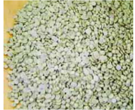
Soufre granulaire (S 04 , 90 %)

Nous avons appliqué le soufre au printemps après l'émondage, mais vous pourriez le faire à d'autres moments de l'année, sauf si le sol est gelé ou s'il est saturé d'eaux stagnantes ou si les feuilles des plants sont mouillées. L'application de soufre à la prélevée au printemps après l'émondage des plants présentera le moins